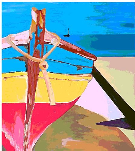
Mostra. Una delle opere della rassegna allo Stand Florio

● Domani dalle 9, e fino a domenica, il circolo Arci Pasol si apre alla città di Partinico ospitando la manifestazione Scienza Radicata . Tre giorni di socialità, formazione, dibattiti, esplorazione del territorio, riappropriazione di conoscenze, per una politica dal basso. Si comincia con due laboratori sul cambiamento climatico negli istituti Casarà e Savarino, per trasferirsi nel pomeriggio nella sede del Pasol dove si terrà un dibattito su Pedagogia politica, un esempio nella storia, una pratica per cambiare la città .