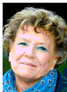
Contro la violenza. A sinistra la sala del Real Teatro Santa Cecilia che sabato ospiterà l'evento, sopra la scrittrice Dacia Maraini