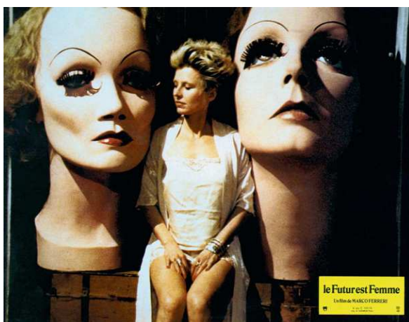
"Il futuro è donna" di Marco Ferreri con Hanna Schygulla, 1984.

Sono diversi e intrecciati tra loro i temi del Sicilia Queer Filmfest 2017, declinati in tutte le controverse sfaccettature del contemporaneo: fughe, nomadismo, tecnologia, nevrosi, alienazione, crisi della famiglia tradizionale e nuove prospettive relazionali, che sono affrontate sia con la leggerezza e l'ironia della commedia, sia con le asperità del dramma. In particolare, è centrale quest'anno lo sguardo femminile su erotismo, sessualità e rapporti interpersonali.