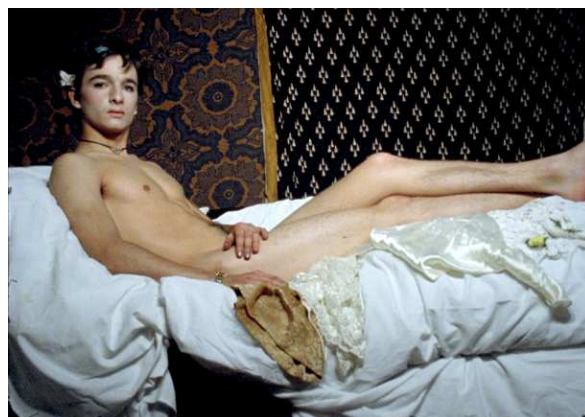
“Olympia I & II” di Gabriel Abrantes e Katie Widloski

Questa edizione del Sicilia Queer Filmfest comprende numerosi film in concorso nella sezione lungometraggi Nuove Visioni , e nella sezione di corti Queer Short , opere fuori concorso nella sezione Panorama Queer , una personale (la prima in Europa) dedicata al regista americano di origini portoghesi Gabriel Abrantes , preziose riscoperte nelle sezioni Retrovie Italiane e Carte Postale à Serge Daney , e poi il cinema d'animazione, i laboratori per bambini, le letterature queer, il premio teatrale dedicato a Nino Gennaro , un omaggio al performer Franko B e altro ancora.