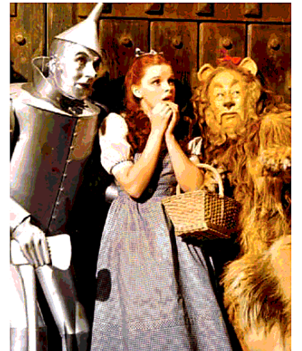
Judy Garland, Dorothy ne «Il mago di Oz»: fra le maggiori icone gay di sempre