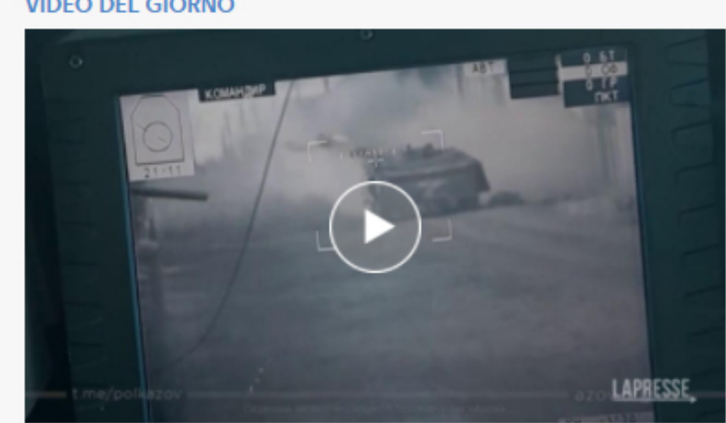
Forze ucraine aprono il fuoco contro un blindato russo a Mariupol