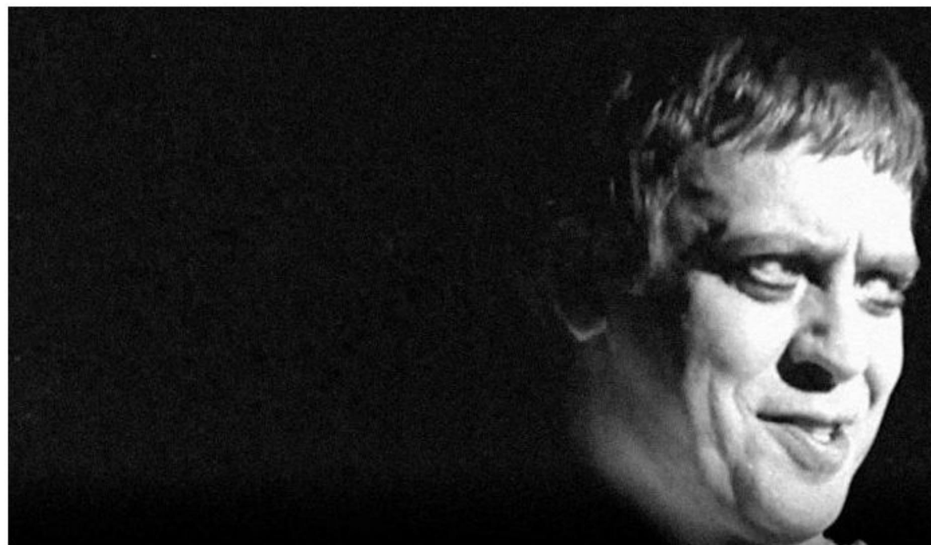
carmelo bene

Palermo. Seconda tappa di avvicinamento alla dodicesima edizione del Sicilia Queer, con la proiezione de Il Sommo Bene – Appunti per un documentario di Chiara Crupi mercoledì 16 marzo alle ore 18.30 al Cinema Rouge et Noir – in collaborazione con Teatro Garibaldi alla Kalsa e Collettivo Cabaret Voltaire. La proiezione avverrà simultaneamente a Torino, Roma, Napoli e Palermo in occasione dei vent'anni dalla morte di Carmelo Bene. Introducono il film Andrea Inzerillo e Matteo Bavera.