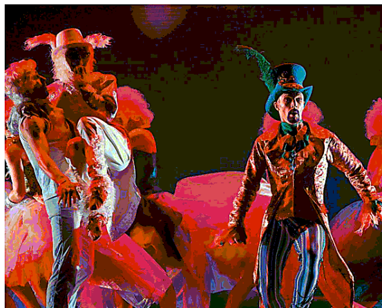
▲ La scena Un momento di "Alice in wonderland"