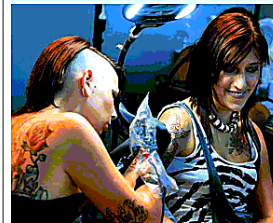
▲ I tatuatori Un'operatrice