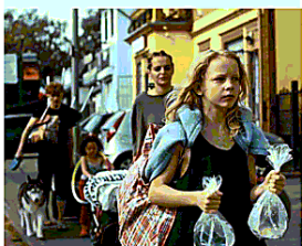
▲ Il film "Petite nature"

Il Sicilia Queer Film Fest apre la sua quinta giornata alle 16 al cinema De Seta dei Cantieri alla Zisa con "Grosse Freiheit" di Sebastian Meise (Germania, Austria 2021), dramma con echi kaffiani in cui il protagonista ci fa evadere dalla prigione mentale che accompagna l'esperienza della carcerazione. Spazio ai libri con "Drag. Storia di una sottocultura", di Eleonora Santamaria che dialogherà con Sofia Torre. Il libro si presenta alle ore 18 al Cre.Zi. Plus. Alle 18.15 appuntamento con "Tempesta su Washington" (Stati Uniti, 1962), classico della storia del cinema firmato da Otto Preminger. Si prosegue alle 20.30 con "Petite Nature" di Samuel Theis (Francia, 2021), mentre 22.30 si proiettano i cortometraggi. Alle 22.30 i Candelai ospita il Queer Party, per una serata di musica e balli, con dj set a cura di Ethik, Eva Ernst, A Colder Consciousness.