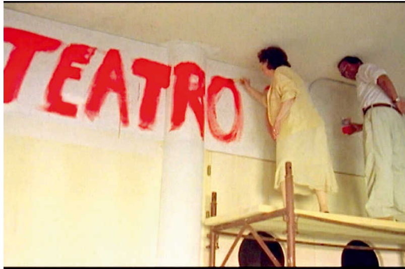
Una scena di “Shakespeare a Palermo” di Francesca Comencini

Il Premio Nino Gennaro va a Bruce LaBruce: artista radicale del queercore che lavora tra pornografia e cinema d'autore e che chiuderà il festival con un dj set. La sezione Panorama Queer si dirama in tre programmi: “Because the night”